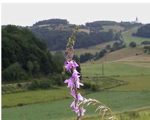
Veytal mit Kirche von Weyer

Wo links der Wald zurückweicht, verlassen wir den EV-Weg nach rechts und gehen bergan auf einem Waldweg, der uns auf den Höhenrücken des Ravelsberg führt. Hier ist in den letzten Jahren ein großer Windpark entstanden. Wir erreichen einen Asphaltweg, auf dem der Römerkanal-Wanderweg verläuft. Hier rechts. Wir folgen diesem Weg, der den Hagelberg nördlich passiert (Achtung! ca. 100 m nach einer Jägerhütte scharf rechts und gleich wieder links abwärts). Von hier ist es 1 km bis zur Römischen Brunnenstube.