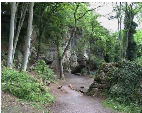
vor der Kartsteinhöhle

Wanderzettel 33 W28 2001 Nordeifel Dreimühlen