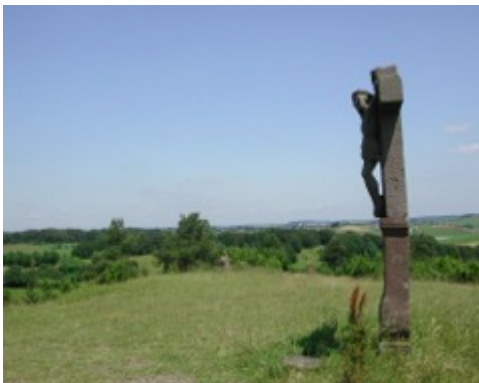
Blick vom Kalvarienberg