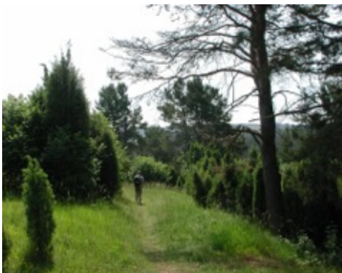
Wachholder am Höneberg

Wir überqueren die Kreisstraße und gehen rechts der Kirche hinab auf dem Wacholderweg (W) in die Wiesen. Am Ortsausgang, wo Wege in fünf Richtungen abgehen, gehen wir halblinks und überqueren einen kleinen Bachlauf. Wir erreichen einen Querweg an einer Weide und wandern nach links am Zaun entlang. Den ersten Weg wieder nach rechts aufwärts bis zu einen asphaltierten Fahrweg, hier links abwärts.